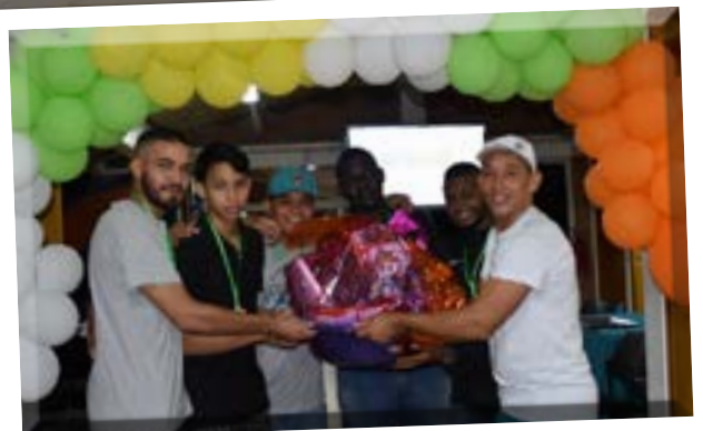
Administración de empresas. Equipo campeón.