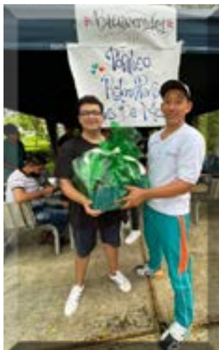
Campeón del torneo