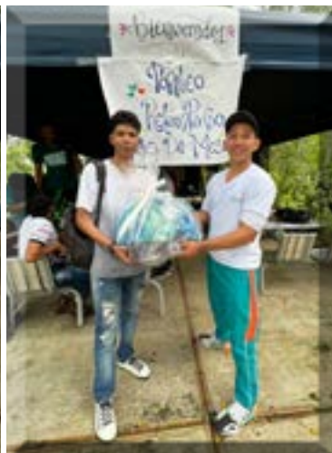
Subcampeón del torneo