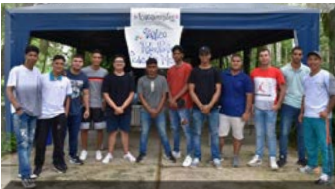
Participantes del torneo