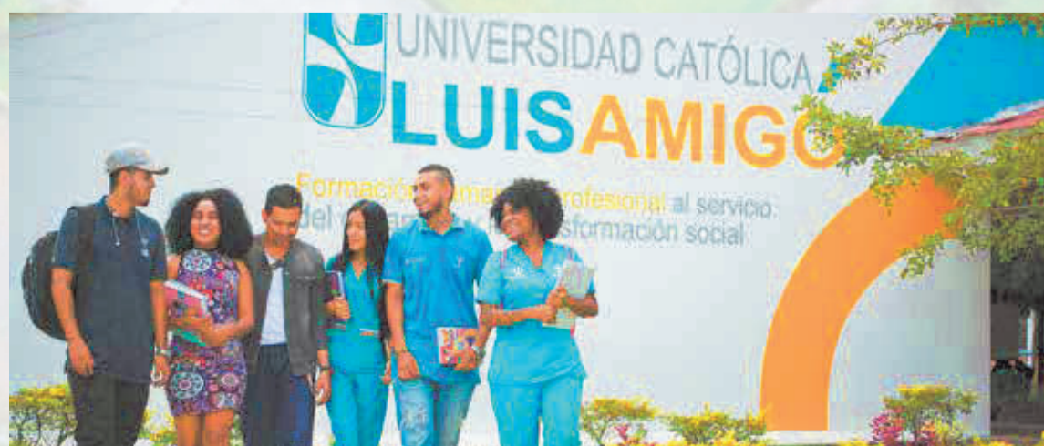
Los estudiantes de la Luis Amigó reciben sus clases en aulas con equipos de cómputos, frescas y aptas para el aprendizaje

Como proyectos próximos para el Servicio de la Comunidad, la universidad informa sobre la futura apertura del Centro de Atención Especializado (La Lucila) para el menor infractor, en el municipio de Turbo, que será un establecimiento liderado por la comunidad religiosa de los Terciarios Capuchinos y la instalación y apertura del consultorio psicológico en el Centro Regional Apartadó.