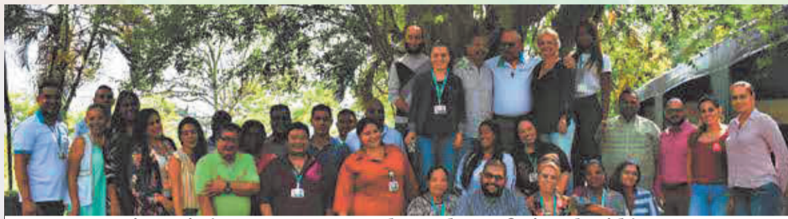
La Luis Amigó cuenta con una planta de profesionales idóneos con especializaciones y maestrías.

En Turbo se tendrá a futuro la apertura del Centro de Atención Especializado (La Lucila) para el menor infractor, que será un establecimiento liderado por la comunidad religiosa de los Terciarios Capuchino, quienes son los fundadores de la Universidad.