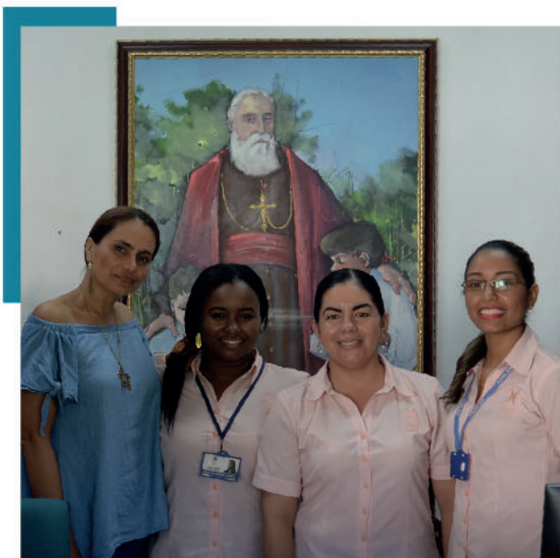
Integrantes Familia Universitaria en Apartadó

L a Universidad Católica Luis Amigó Centro Regional Apartadó llegó hace 31 años a la zona de Urabá con el proyecto inicial de capacitar a los docentes del territorio, brindándoles más oportunidades de aprendizaje y nuevas herramientas para su vida laboral, iniciando con las primeras especializaciones para suplir las necesidades de la región; cabe recalcar que la situación de violencia y conflicto estaba muy radicalizada y era una zona de difícil acceso, debido a esto muchas de las universidades que se encontraban allí decidieron cerrar sus puertas, sin embargo la universidad por la apuesta social y la credibilidad de la región por sus riquezas y potencial decidió hacer frente y seguir con los proyectos académicos.