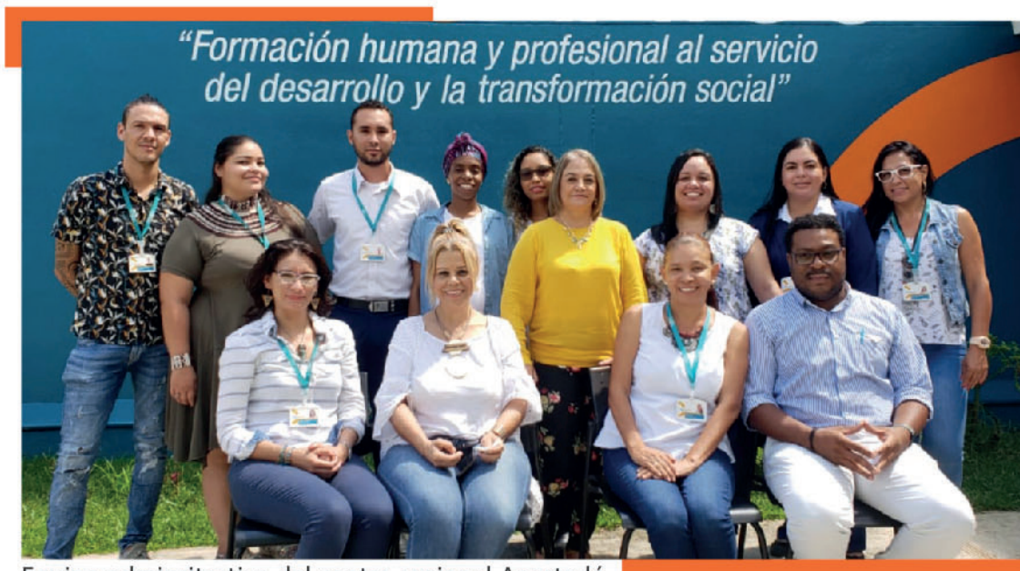
Equipo administrativo del centro regional Apartadó.

Debido a esto para el año 2000 la universidad decide ampliar su oferta académica, diversificando nuevos programas. Gracias a la gran acogida por parte de la comunidad se decide tener una sede propia, ubicada en el barrio La Navarra en el municipio de Apartadó. Se reconoce por ser una sede campestre, con aproximadamente cuatro hectáreas, con el pasar del tiempo llegan los programas presenciales, el incremento de población estudiantil y la credibilidad de la institución. La Universidad se ha posicionado como una de las mejores y más asequibles en la región, con reconocimiento y con la proyección de seguir expandiendo su oferta académica presencial y tener un desarrollo social cada vez mayor.