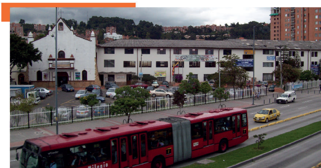
Centro regional Bogotá

Un claro ejemplo son las agencias de práctica (instituciones, ONG'S, fundaciones, centros de rehabilitación, IPS y EPS) donde realizan sus prácticas académicas de formación profesional y producto de ese espacio académico, los estudiantes ponen en evidencia sus conocimientos generales y específicos adquiridos durante su proceso de formación. Es así como, al terminar su práctica, algunas instituciones los contratan como profesionales para que continúen realizando las actividades que desempeñaron con éxito.