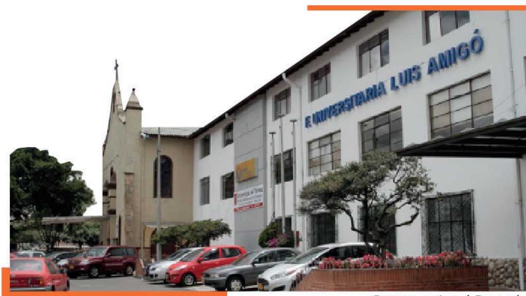
Centro regional Bogotá

Estas razones, hacen que el equipo universitario continúe trabajando cada día para seguir aportando a la sociedad profesionales con alto sentido humano y social con capacidades orientadas a fortalecer el pensamiento crítico y ético para proporcionarle al mundo soluciones que dinamicen los procesos humanos, psicológicos y emocionales en cada contexto en el que se encuentren vinculados los graduados, que sean agentes de cambios que se transformen así mismos cada día y constructores de nuevas realidades para una sociedad más flexible y abierta donde se respeta la autonomía, la crítica social y cultural.