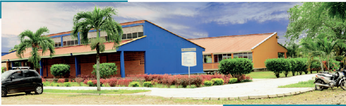
Centro regional Apartadó

Debido a esto para el año 2000 la universidad decide ampliar su oferta académica, diversificando nuevos programas. Gracias a la gran acogida por parte de la comunidad se decide tener una sede propia, ubicada en el barrio La Navarra en el municipio de Apartadó. Se reconoce por ser una sede campestre, con aproximadamente cuatro hectáreas, con el pasar del tiempo llegan los programas presenciales, el incremento de población estudiantil y la credibilidad de la institución. La Universidad se ha posicionado como una de las mejores y más asequibles en la región, con reconocimiento y con la proyección de seguir expandiendo su oferta académica presencial y tener un desarrollo social cada vez mayor.