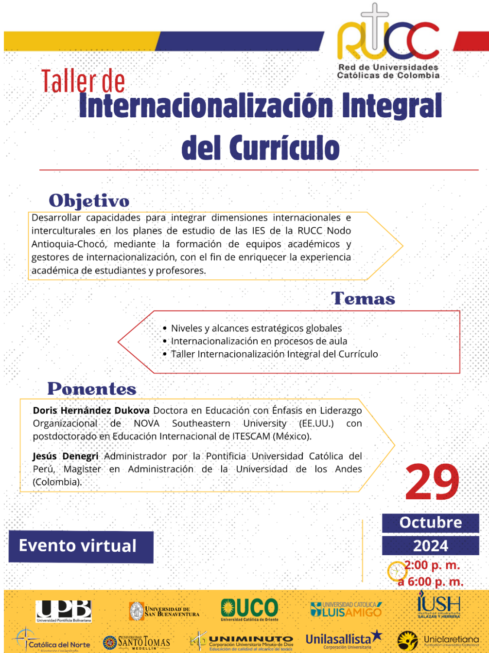
Figura 2. E-card Taller Internacionalización Integral del Currículo. Elaboración propia.