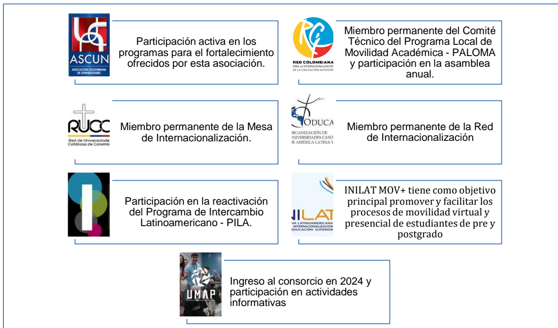
Figura 1. Redes OCRI 2024

En ese mismo sentido, a lo largo de los años, la Oficina de Cooperación Institucional y Relaciones Internacionales ha mantenido una participación activa en diversos espacios académicos relacionados con la internacionalización de la educación superior y 2024 no fue la excepción. Durante el año, la OCRI reafirmó su compromiso al integrarse en siete redes de colaboración claves. Estas conexiones estratégicas consolidan nuestra presencia en el ámbito académico nacional e internacional, permitiéndonos establecer vínculos sólidos con instituciones líderes y fomentando sinergias que impulsan la calidad educativa y la proyección global de nuestra universidad.