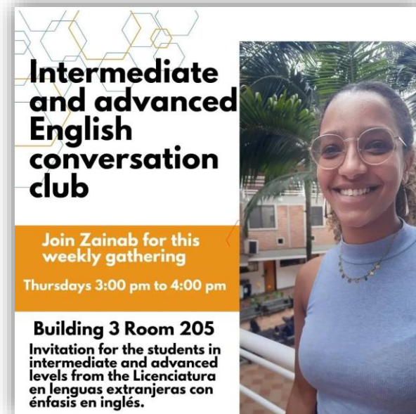
Figura 3. Actividades asistentes de idiomas Medellín.

Estas asistentes, cuya vinculación se realizó a través del convenio con el British Council, apoyan los procesos de enseñanza y aprendizaje del inglés, contribuyendo al fortalecimiento de la competencia lingüística de estudiantes y docentes. Una de ellas se encuentra en el Centro Regional Manizales y la otra en Medellín, donde desarrollan actividades académicas y culturales que enriquecen la internacionalización en casa. Su permanencia en la Universidad se extenderá desde agosto de 2024 hasta mayo de 2025.