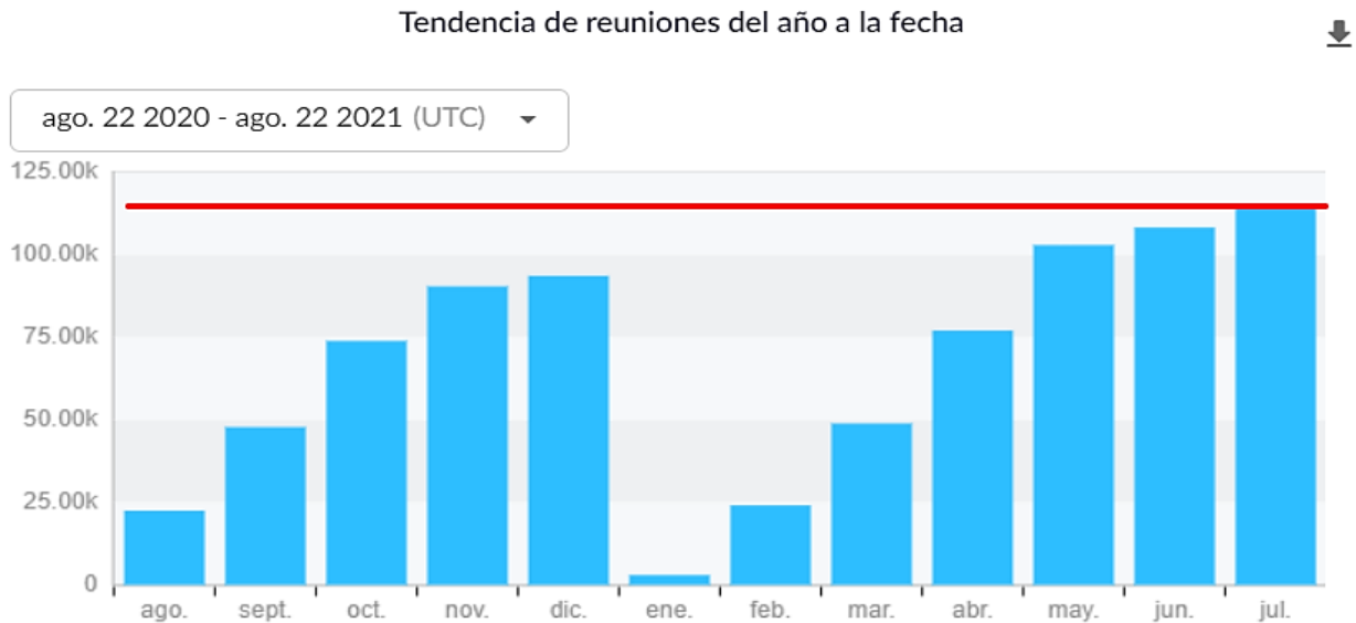
Gráfico 2. Número de sesiones sincrónicas mensuales desde agosto de 2020.

de 2021 se pudo apreciar un crecimiento importante en el número de sesiones desarrolladas a través de Zoom, lo que da cuenta de su grado de apropiación por parte de la comunidad amigoniana: