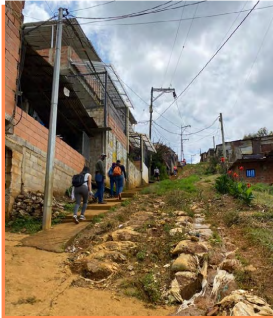
Figura 1 Sector Oasis de paz

Nota. Se evidencia la pendiente mitigada por costales de tierra y basura.