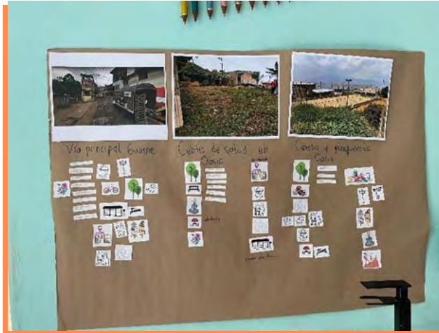
Figura 8 Taller de priorización

Nota. Elección de tipologías de vías para la vereda.