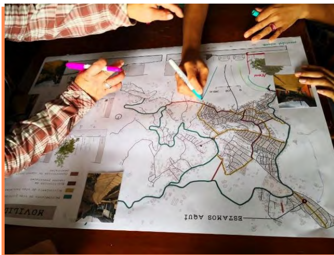
Figura 7 Talleres de diseño

Nota. Elección de tipologías de vías para la vereda.