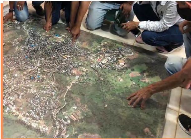
Figura 4 Taller de participación

Nota. 2020. Primer taller de diseño participativo, fase de identificación.