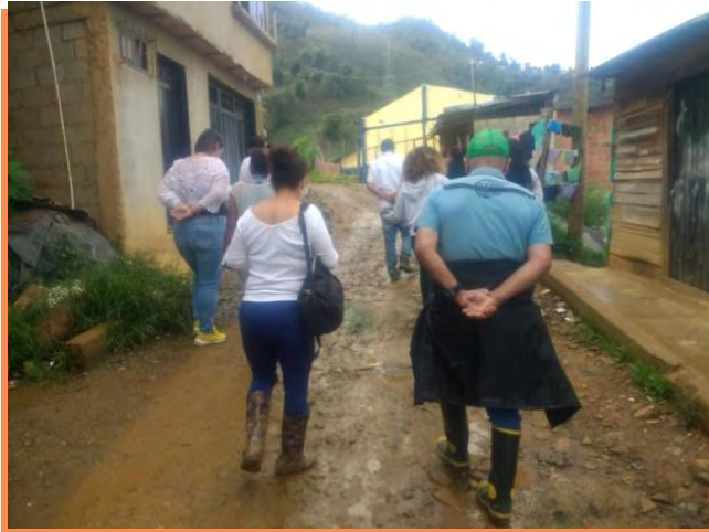
Figura 5 Recorridos con la comunidad

Nota. Relación de la vivienda con calle principal destapada.