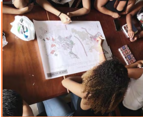
Figura 3 Taller de participación

Nota. Momento en el que se desarrolla uno de los talleres participativos con la comunidad.