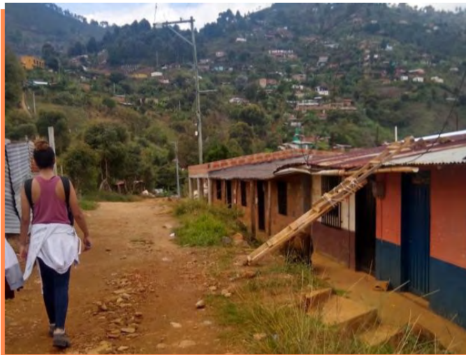
Figura 6 Recorrido Vía Manantiales de paz

Nota. Recorrido de reconocimiento con la comunidad.