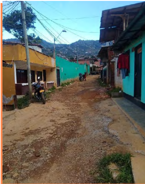
Figura 2 Sector el Siete

Nota. Se observa una de las vías principales completamente destapada.