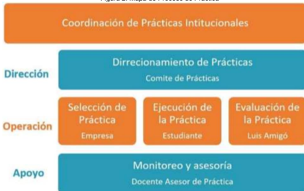
Figura 2. Mapa de Proceso de Práctica