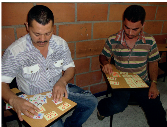
Imagen 4. Clase de lecto-escritura

Estudiantes de segundo grado con necesidades educativas (trastorno mixto del aprendizaje) especiales, en clase de lecto-escritura: unión de sílabas para formar palabras monosilábicas. julio de 2011.