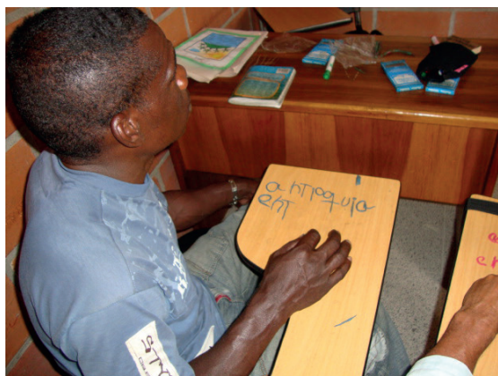
Imagen 3. Desarrollo motriz de estudiante con dislexia

Aprestamiento motriz fino a partir de la manipulación de plastilina y repaso del alfabeto; estudiante de primer grado que presenta múltiples características de dislexia (trastorno de la lectura). Foto tomada por Luisa Fernanda Ríos, julio de 2011.