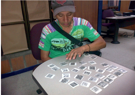
Imagen 6. Ejercicios de denominación visual de imágenes

Estudiante de primer grado en atención individual para estimulación cognitiva, ejercicios de denominación visual de imágenes. Foto tomada por Luisa Fernanda Ríos, mayo 2013.