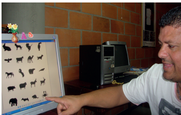
Ejercicios de conciencia fonológica y discriminación visual, estudiante con dificultades auditivas. Foto tomada por Luisa Fernanda Ríos, octubre de 2012.