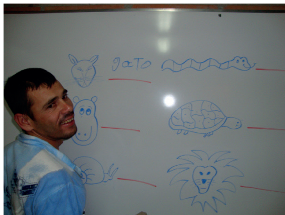
Imagen 1. Estudiante de primer grado.

Estudiante de primer grado; su proceso lector avanza significativamente, pero su proceso escrito muy poco; ya presenta digrafía (trastorno de la escritura).