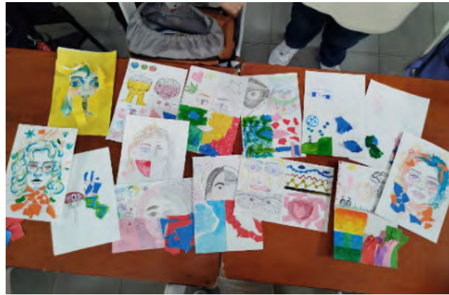
Taller Emociones Plasmadas

El bienestar docente también ha sido una preocupación central de la Facultad. Se han indagado y planteado diversas estrategias para apoyar a los docentes y reconocer que su bienestar es crucial en la construcción de un ambiente de aprendizaje positivo. Estas acciones incluyen sesiones de relajación, espacios de calma, reflexión y actividades que promueven la salud mental de los educadores.