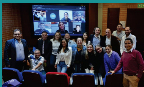
Docentes que asistieron al 4º de la Red Colombiana de Periodismo Universitario en Bogotá