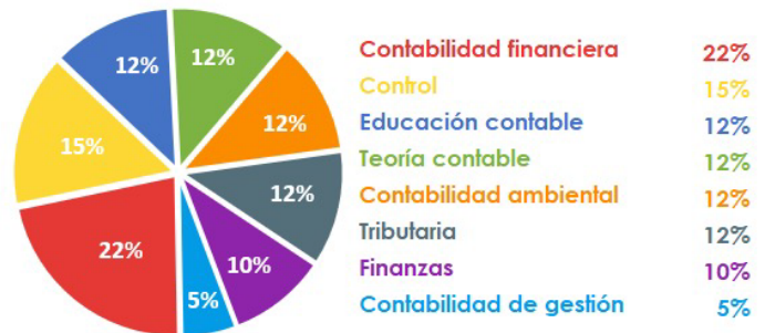
Figura 2. Líneas de investigación por área a 2019

cación contable dejó de ser la línea más estudiada en el país, tema que ha tenido esfuerzos para lograr superar las problemáticas de la formación del contador público, pero en este momento es superado por contabilidad financiera y control.