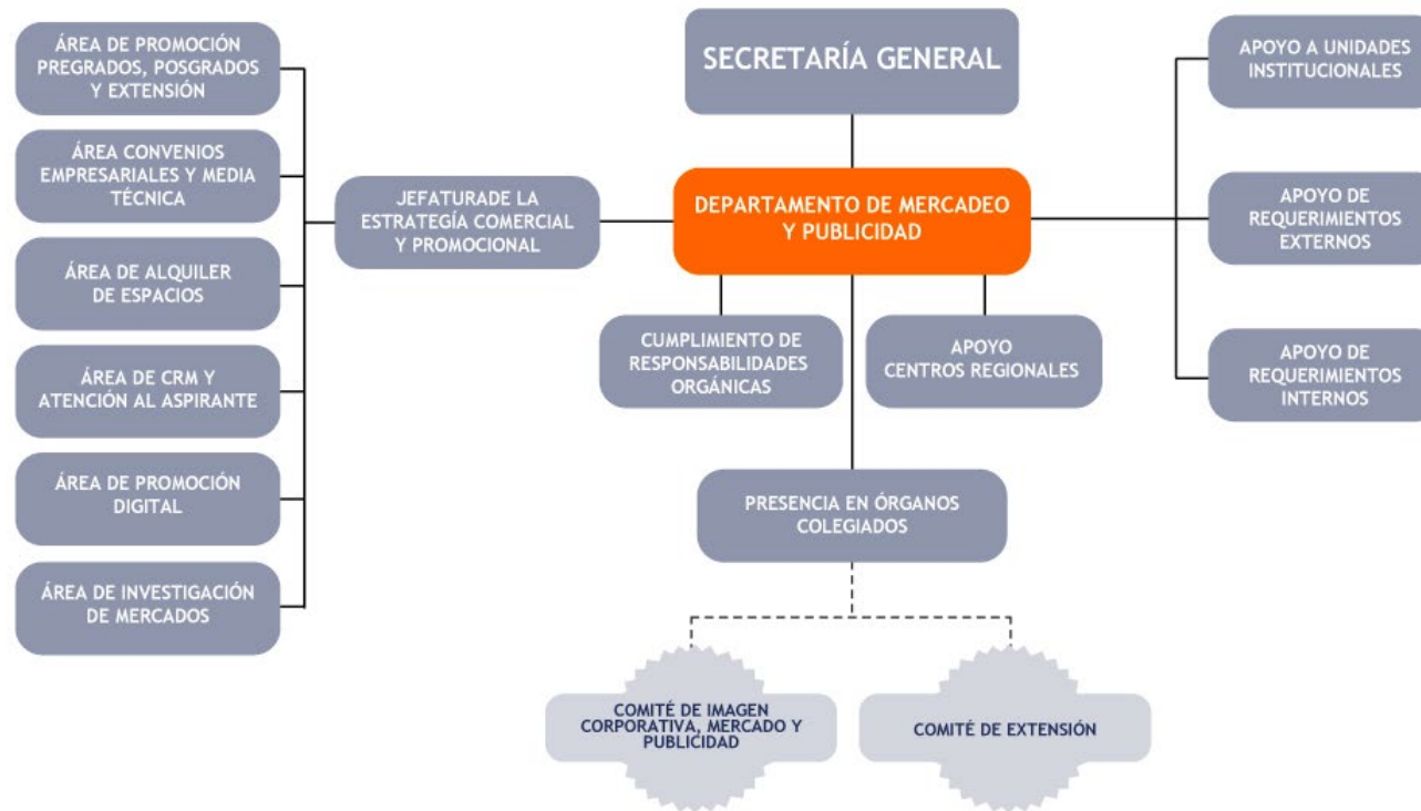
GRÁFICO DIAGRAMA FUNCIONAL

8. Gráfico organigrama funcional proyectado. Debe indicar líneas de mando, líneas de apoyo asesor, con articulación de responsabilidades procesos y personas, indicar la línea de tiempo de la proyección.