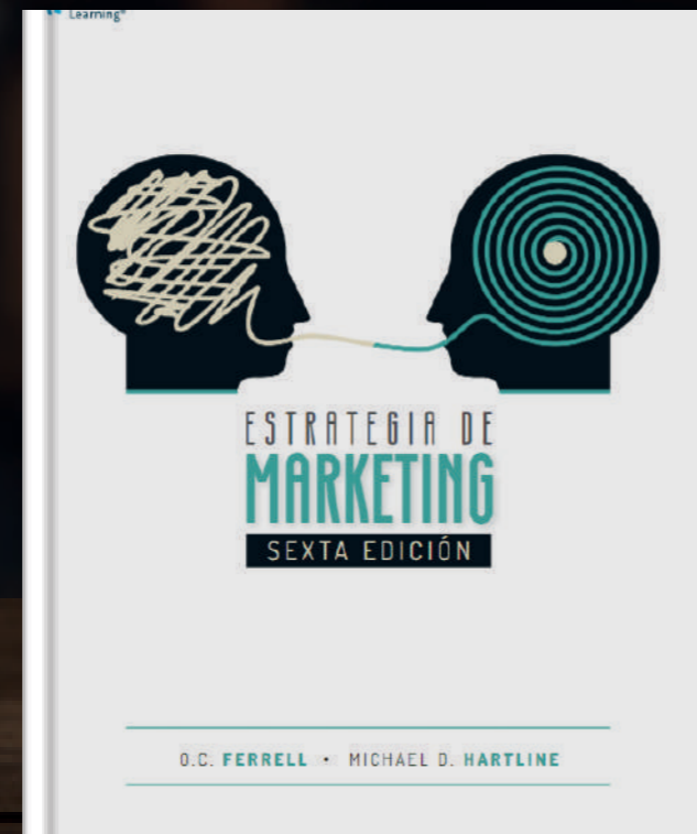
Estrategia de marketing