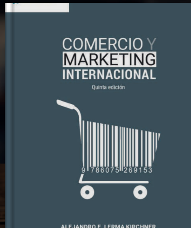
Comercio y marketing internacional