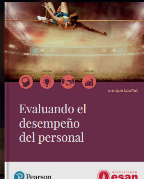
Evaluando el desempeño del personal