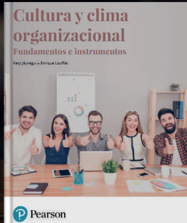
Cultura y clima organizacional. Fundamentos e instrumentos