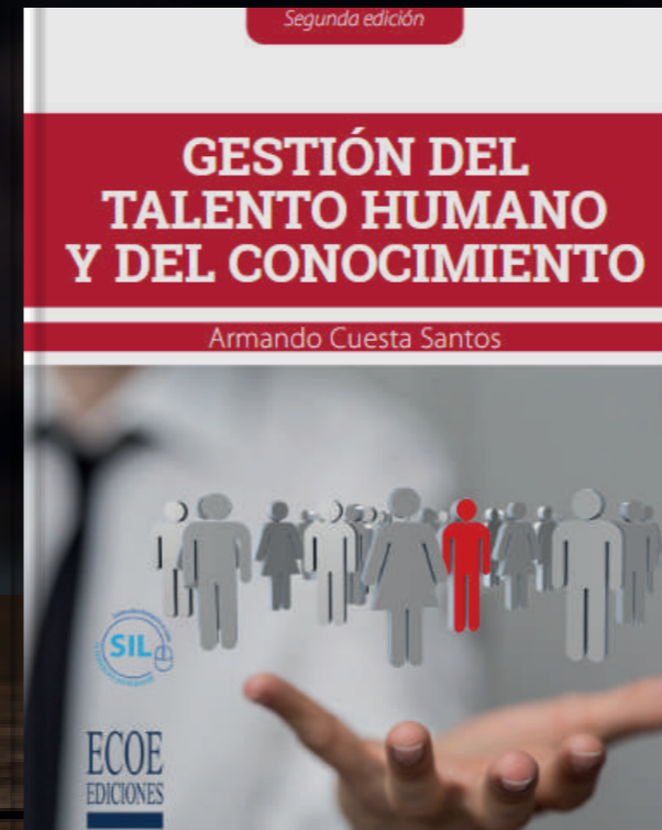
Gestión del Talento Humano y del Conocimiento